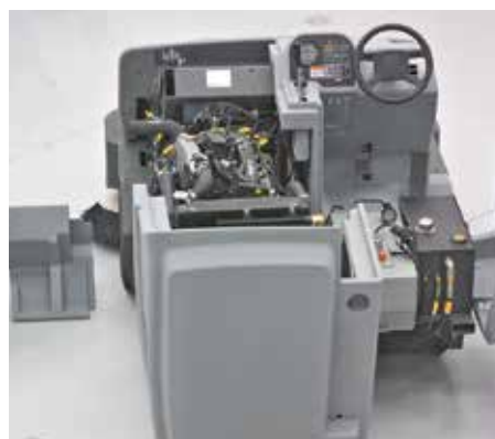
Le concept No Tools™ facilite la maintenance. La carrosserie s'ouvre totalement pour un accès complet au moteur et aux composants hydrauliques