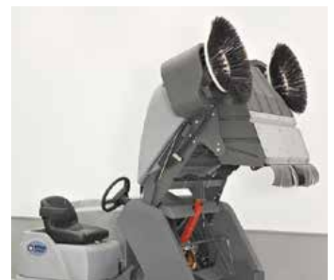
La SW8000 offre une exceptionnelle hauteur de vidage, jusqu'à 1,52m. L'opérateur peut facilement contrôler le vidage car il bénéficie d'une excellente visibilité