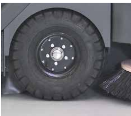
Les larges roues permettent de se déplacer facilement et de surmonter tous les obstacles