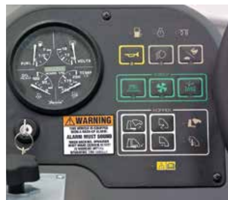
Le fonctionnement de la machine est facile, grâce au concept One Touch™, mise en marche rapide avec une seule commande