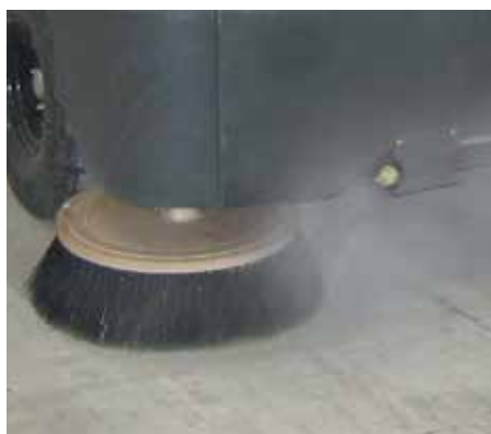
Le système exclusif DustGuard™ permet un contrôle total de la poussière au niveau des balais latéraux